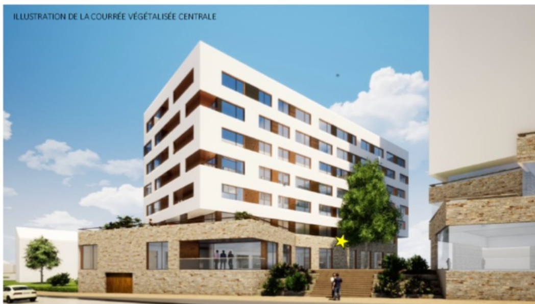
Figure 27 : localisation du nichoir pour moineau dans la nouvelle construction - vue annoté tso senn 2023

★ Localisation du nichoir à moineau de compensation