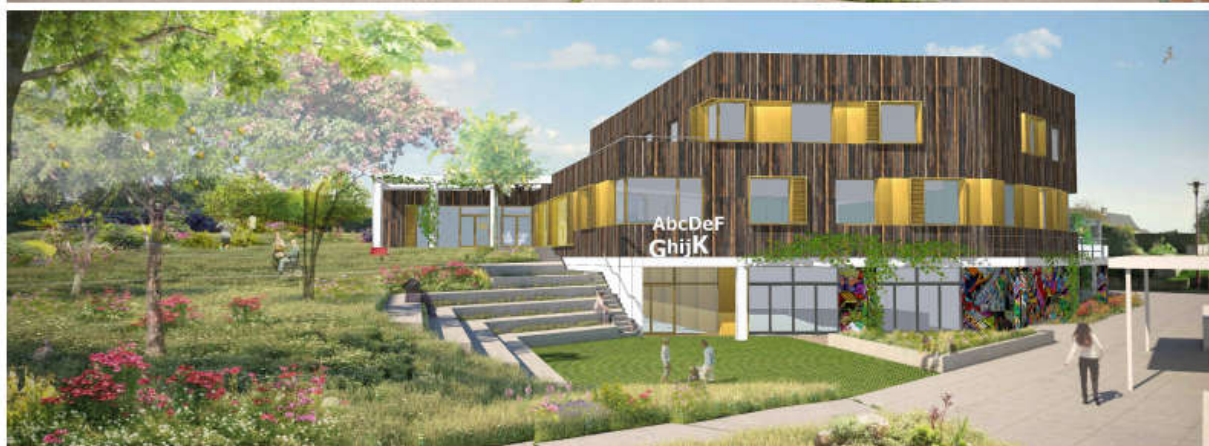
Agence MAGMA Architecture et FOLK Paysage