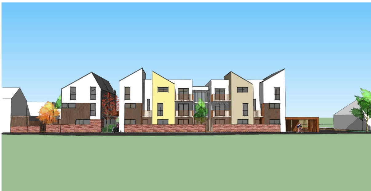
Les Foyers (Maîtrise d'ouvrage) – Agence Croslard (Maîtrise d'œuvre)