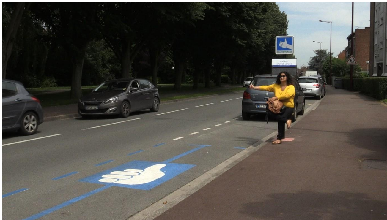
Exemple de station de "court-voiturage" à Marcq-en-Barœul (Nord)

Fort du constat du diagnostic, certaines zones ont fait l'objet de repérage de présence d'autostop. Il s'agirait d'accompagner le développement de cette pratique de covoiturage dynamique tout en la sécurisant. Ces zones de dépose minute pourraient permettre de donner de la visibilité à cette pratique. Ainsi quatre zones de pertinence ont été identifiées. Concernant la zone à proximité de l'échangeur 29, cette question a été intégrée à l'étude conduite par Fougères Agglomération au second semestre 2019 sur la création du pôle d'échange multimodal. Concernant ceux situés sur l'axe Fougères – Louvigné-du-Désert, ces espaces devront faire l'objet d'une identification précise de zones. Ces dernières pourraient s'articuler avec les arrêts de transport collectif de la ligne 18 BreizhGo. Un travail devra donc être conduit avec le futur délégataire de transport de Fougères Agglomération, la région Bretagne chargée de l'exploitation de cette ligne et le Conseil Départemental, opérateur de voirie.